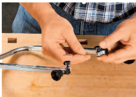
EINFACH: Das Sägeblatt in die Sacklöcher stecken und mit Rändelschrauben fixieren.